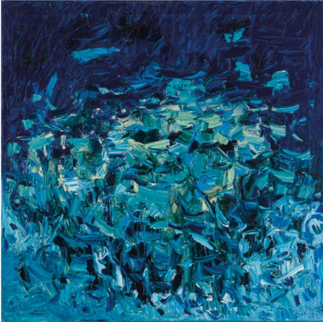
Cromatico mare, notturno con luna , 2020 olio su tela, cm 90x90