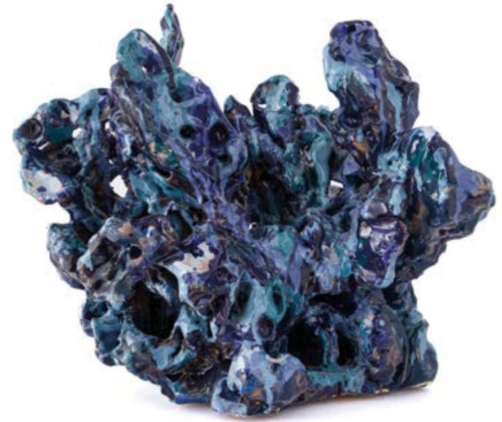
Cromatico mare 2 , 2020 ceramica, cm 36x25x29