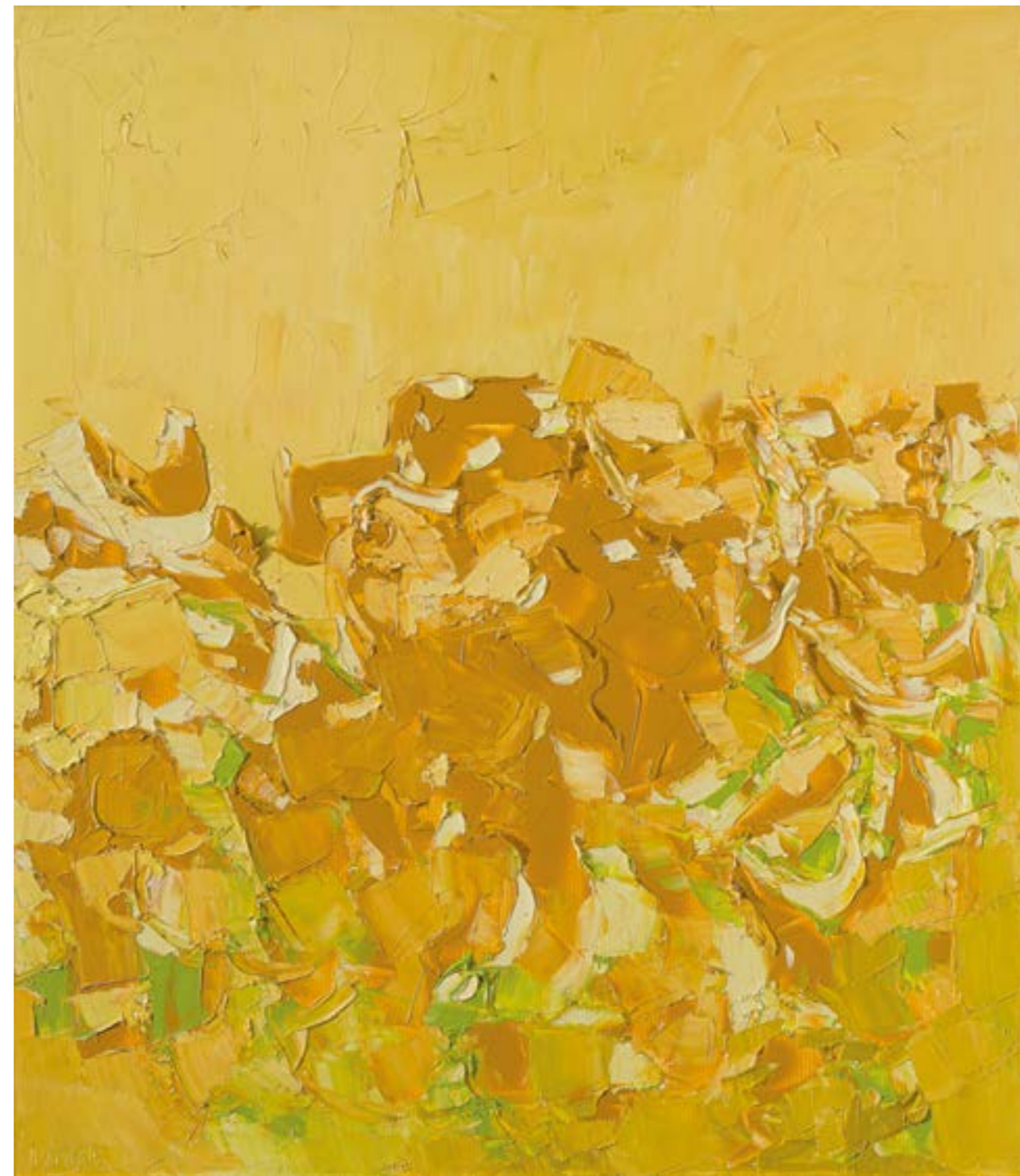
Cromatico mare, ore 18,00, 2019 olio su tela, cm 80x70