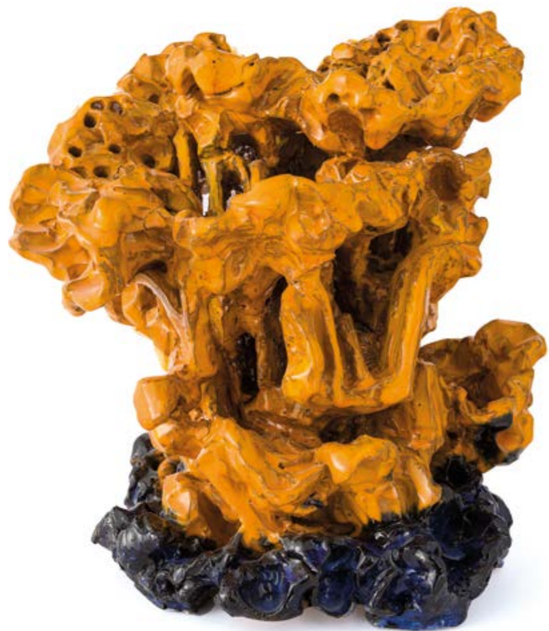
Corallomare, 2021 ceramica, cm 32x34x35