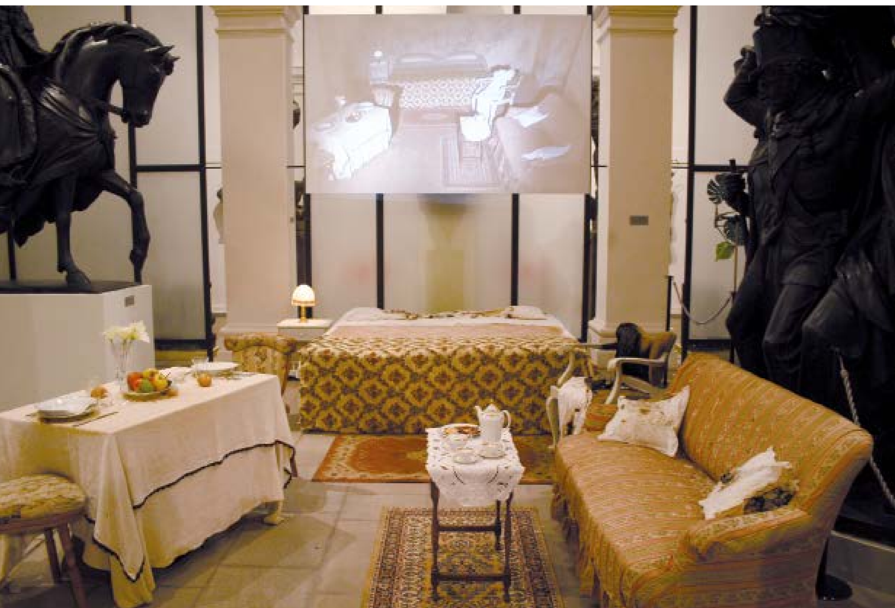
Explosion#16 the couple, 2007 A destra still da video, sopra videoinstallazione Video still on the right, video installation above Tina b., Prague Contemporary Art Festival Lapidarium Narodniho Muzeum