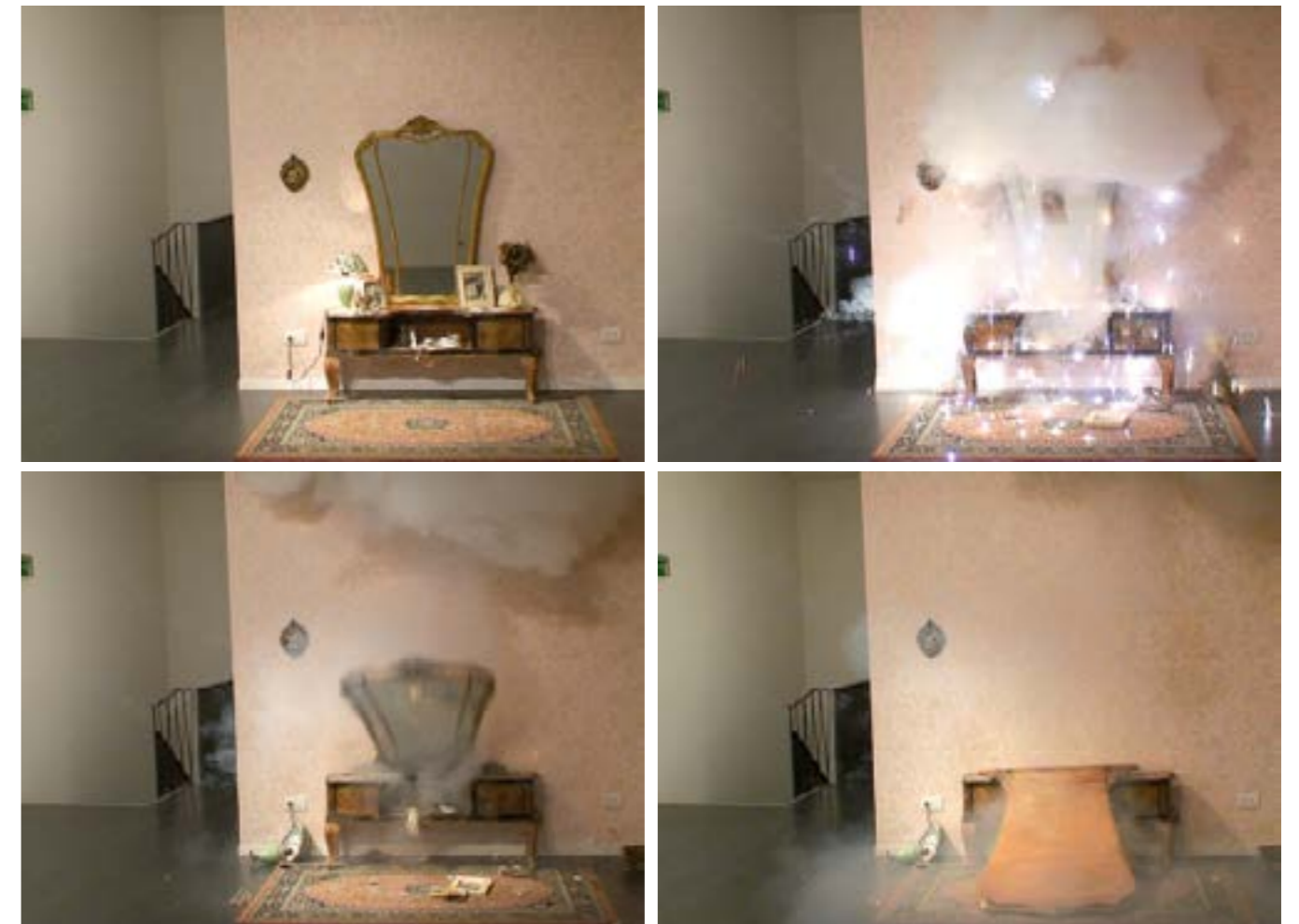
Explosion#11 , 2006 Still da video | Video still Corso Venezia 10 Arte Contemporanea, Milano

Loredana Longo non nasconde il suo pessimismo, ma è in questa posizione di disincanto che trova ragione l'organica concezione del suo pensiero: non esiste riscatto senza consapevolezza, non esiste civiltà senza che si riconoscano i propri limiti, non esiste possibilità di sopravvivenza senza rischio, senza la libertà di affermare con le proprie azioni i valori in cui si crede e per i quali si è disposti anche a mettersi in gioco.