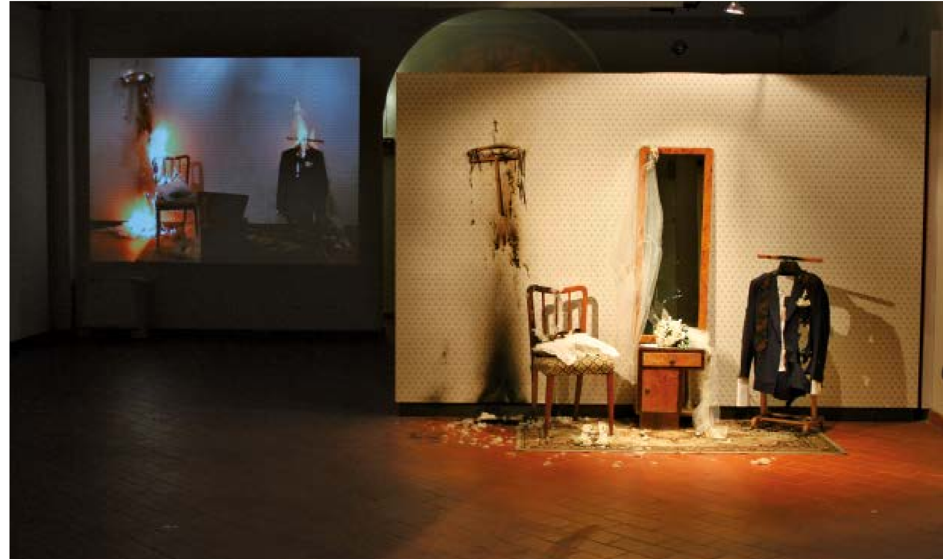
Explosion#13, 2007 Sopra still da video, a destra videoinstallazione Video still above, video installation on the right Spazi ex Siri, Terni