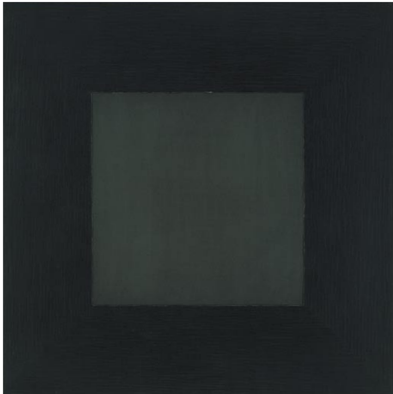
In out and back again (6th) , 1993, egg tempera on panel, cm 89x89

Following pages: Untitled, 1993, diptych, egg tempera on panel, cm 98x196 Raccolta , 1993, polyptych, egg tempera on panel, cm 100x400