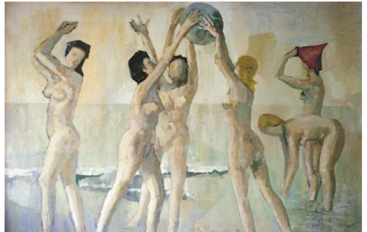
Aurora , 1961-62, oil on masonite, cm 121x182