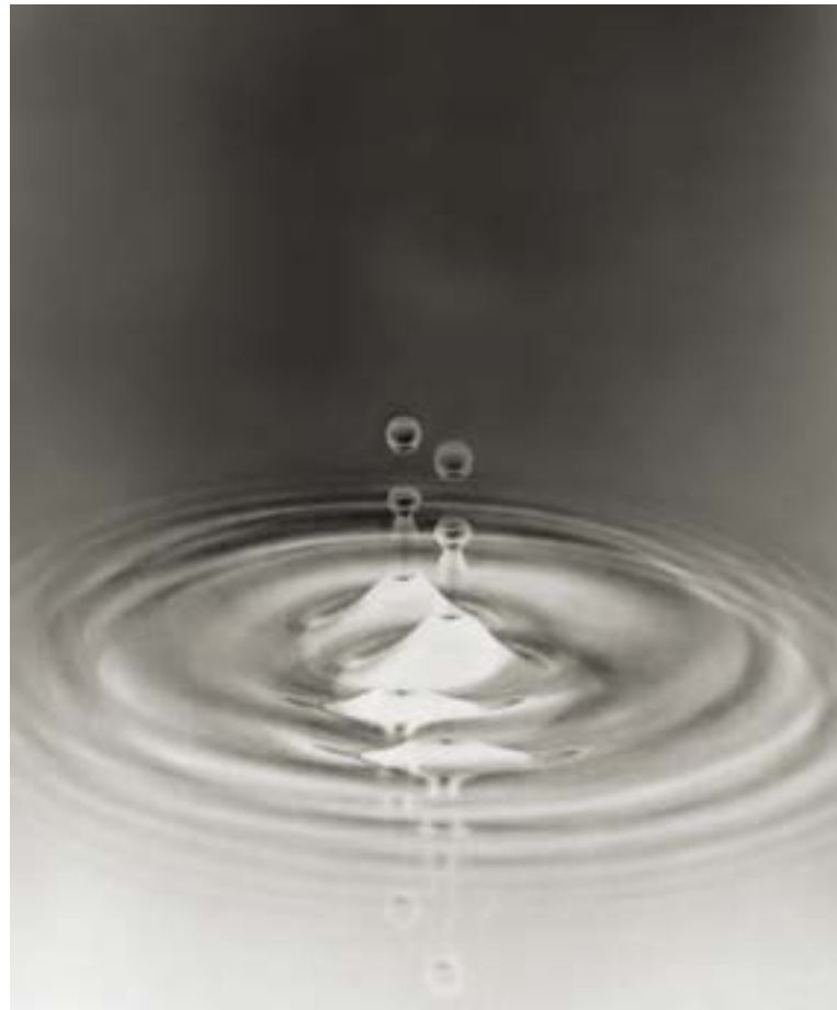
Vedo doppio, 1998

L'œuvre de Serse propose à l'observateur une série d'objets visuels d'une amplitude presque infinie mais cependant précise, voire sélectionnée et systématisée, de façon obsessionnelle que l'on retrouve dans les différents groupes d'œuvres et cycles de ses dessins. Dans ses dessins apparaissent des motifs de la nature, des paysages de montagne avec leurs sommets incroyablement hauts et effrayants, des ciels emplis de nuages avec des effets d'ombre et de lumière dramatiques, diverses surfaces aquatiques marines avec des vagues hautes et profondes, ou des étangs calmes dont la surface est animée par les ombres délicates des roseaux. Mais on y voit également des faits artistiques, des résultats concevables, réels issus du travail et de la production humaine, des motifs (souvent des fragments) d'architecture, des formations géométriques de cristaux, diamants travaillés par l'homme, ou des formes intelligibles, imaginaires et virtuelles de certaines constellations qui ont défini le pouvoir de l'imagination scientifique, les recherches en géométrie et les mathématiques théoriques comme une démonstration de structures intelligibles.