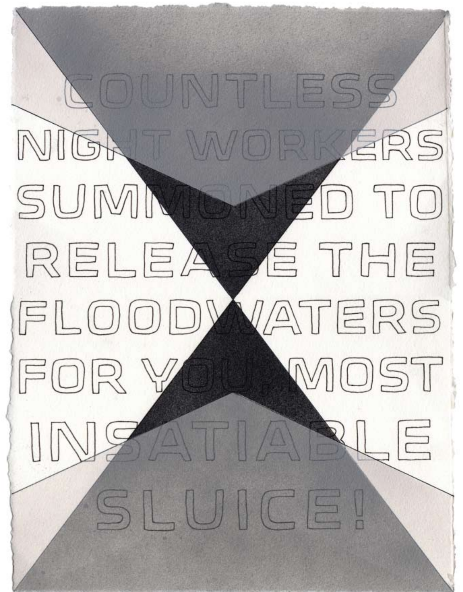
Embalmer's Stone 2, 2010 inchiostro e pittura spray su carta, 30 x 23 cm / ink and spray paint on paper, 12 x 9 inches