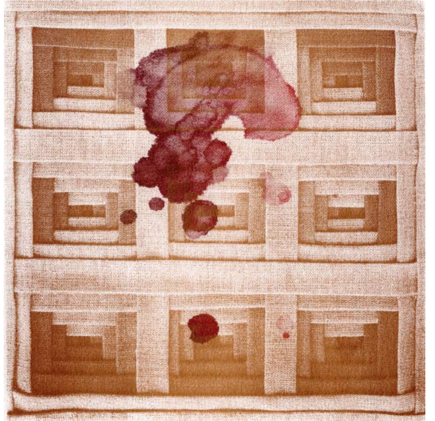
Embalmer's Touch 1, 2010 serigrafia, 23 x 23 cm / silkscreen, 9 x 9 inches