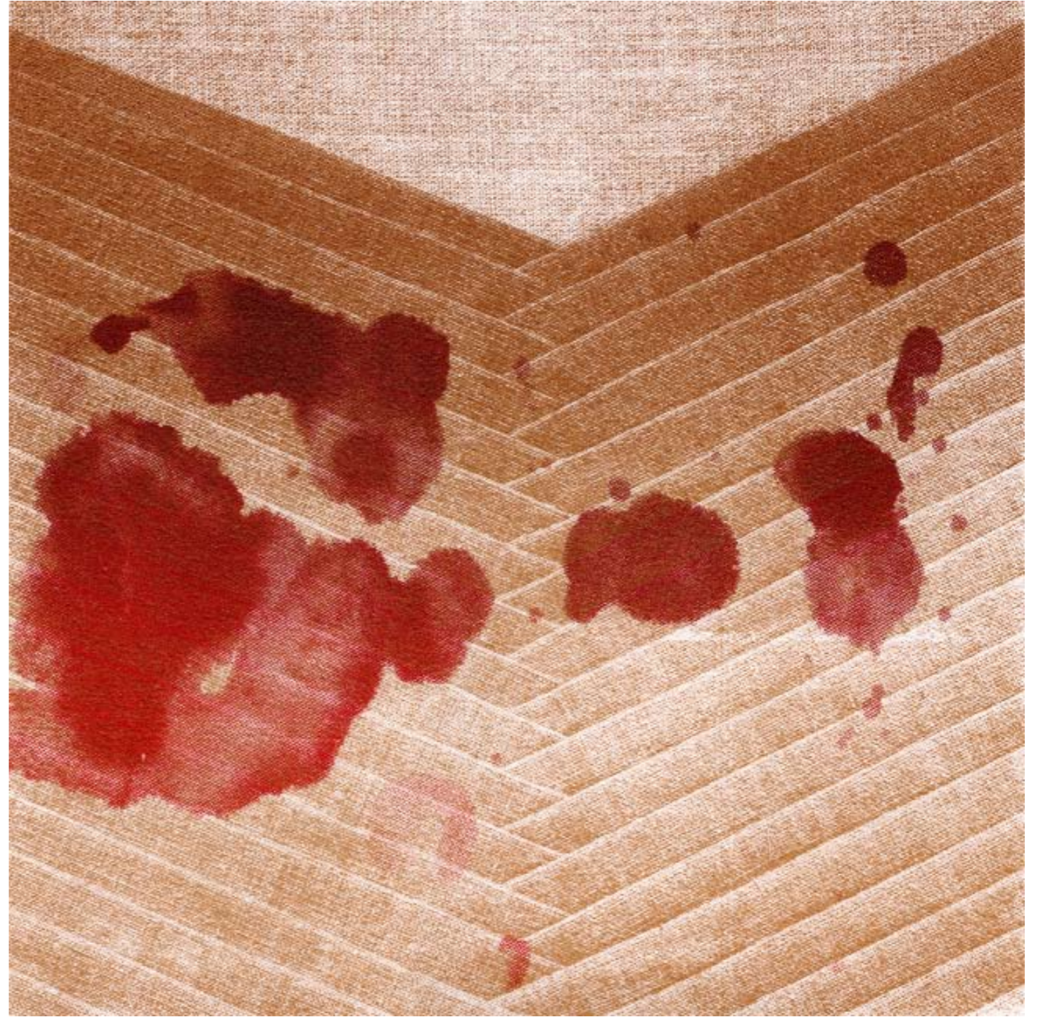
Embalmer's Touch 2 , 2010 serigrafia, 23 x 23 cm / silkscreen, 9 x 9 inches