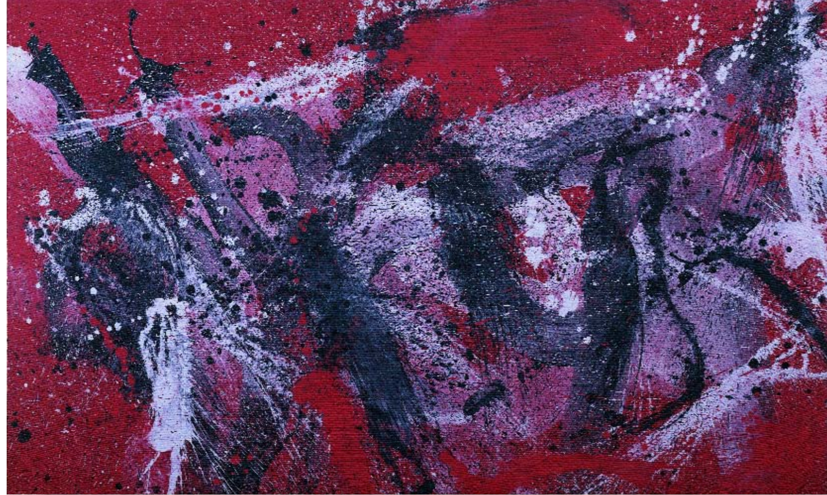
29. Avversario (Adversary), 1990, vinilico su tela / vinyl on canvas, 102,5 x 170,8 cm