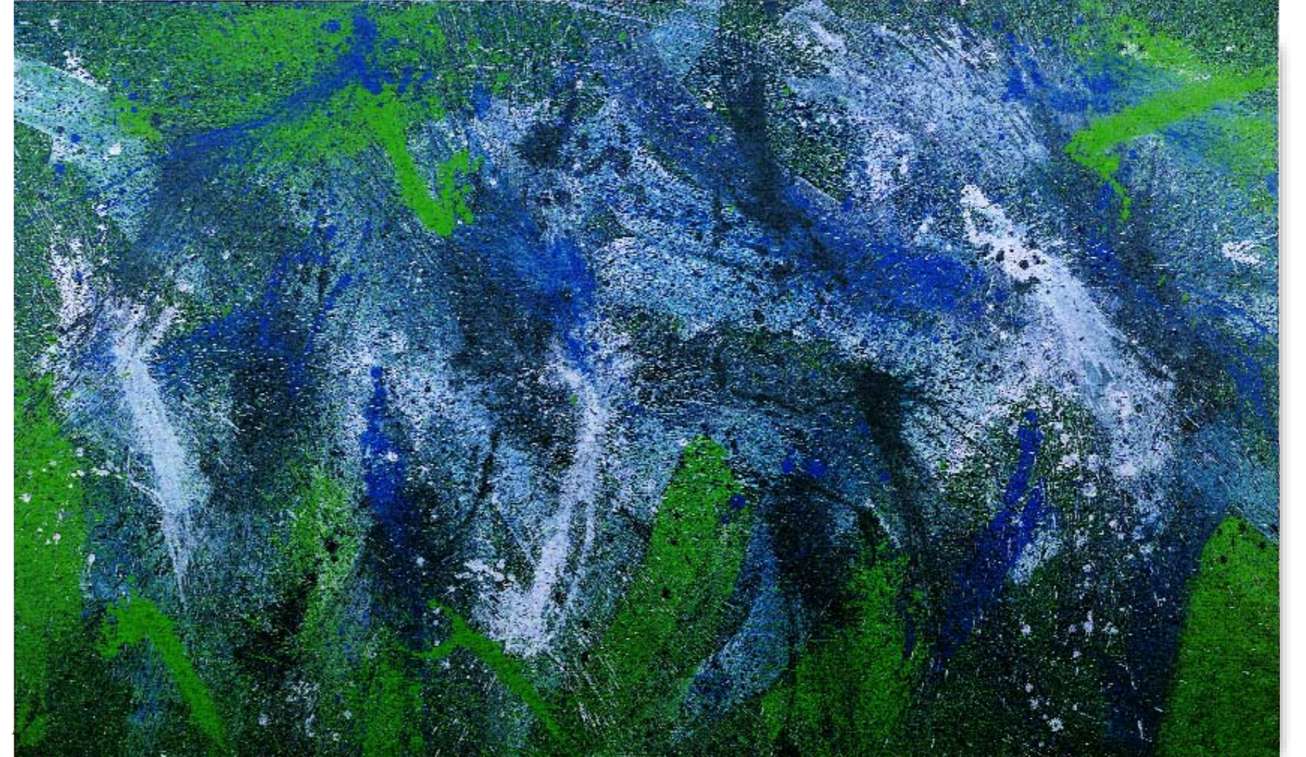
30. Verde (Green), 1990, vinilico su tela / vinyl on canvas, 149,5 x 248,5 cm