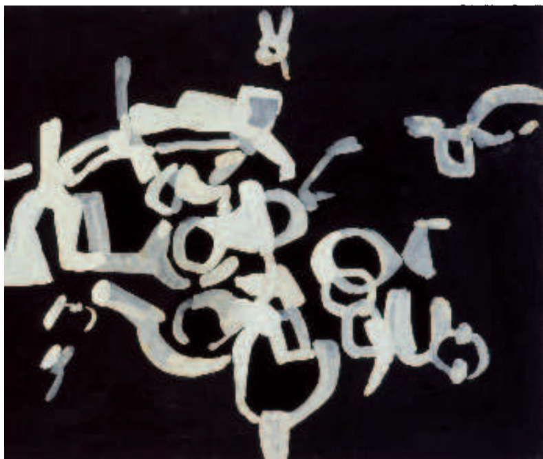
Carla Accardi «Fondonero» (1954)

Colombo , tra i fondatori nel 1959 del Gruppo T, è uno dei massimi esponenti di quel processo di trasformazione dell'arte da forma di rappresentazione a esperienza, attraverso la quale lo spettatore, con la sua visione-azione, può sperimentare percezioni inattese.