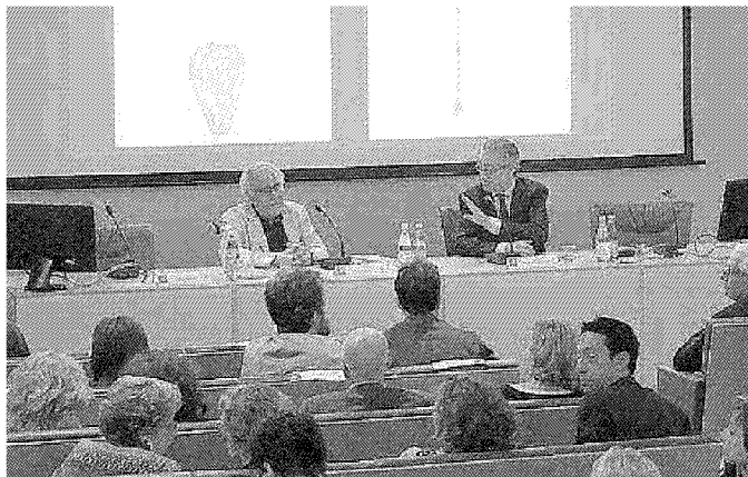
Un momento della presentazione a Palazzo Blu

Saranno esposti a Palazzo Blu fino al 13 settembre i 98 disegni originali, tra cui 14 inediti, che l'artista Mimmo Paladino ha realizzato per illustrare i classici della letteratura internazionale. L'autore ha ammesso di vedere per la prima volta riuniti i suoi disegni grazie a questa esposizione curata da Giorgio Bacci, organizzata dalla Fondazione Palazzo Blu in collaborazione con la Scuola Normale Superiore di Pisa, con il patrocinio del Comune e il contributo della Fondazione Pisa. Le illustrazioni sono state eseguite con le tecniche più varie per arricchire il testo letterario che faceva parte sia di prodotti editoriali a tiratura limitata che per libri curati ma destinati ad un pubblico di lettori più folto. La mostra è divisa in tre sezioni tematiche: il viaggio, le metamorfosi, il poema cavalleresco e il suo doppio. I disegni che fanno par-