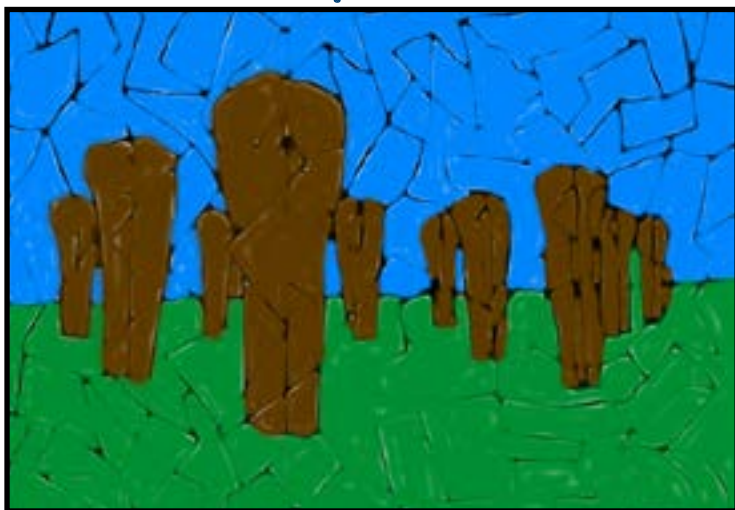
Magdalena Abakanowicz, Katarsis , 1985 Fattoria di Celle, Collezione Gori